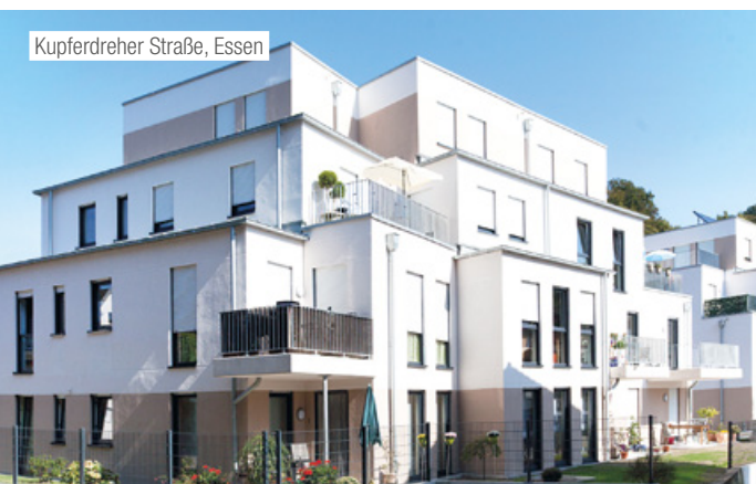
Kupferdreher Straße, Essen