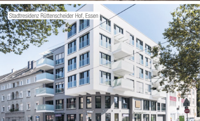
Stadtresidenz Rüttenscheider Hof, Essen