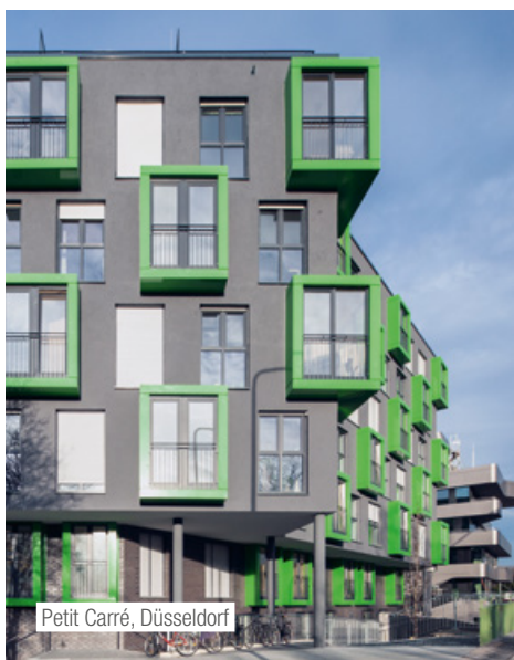
Petit Carré, Düsseldorf