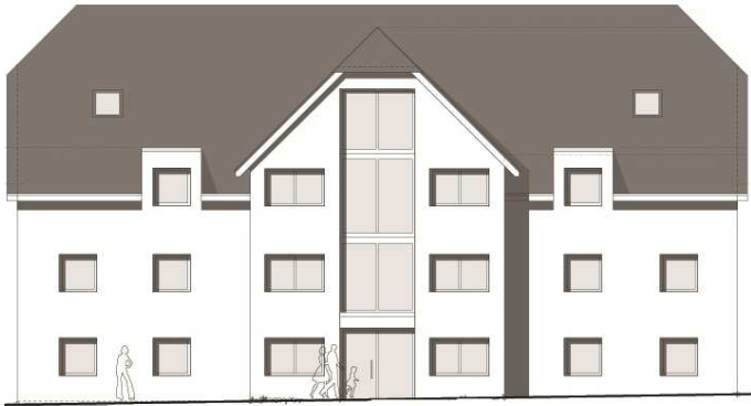
Rückansicht - Eingang